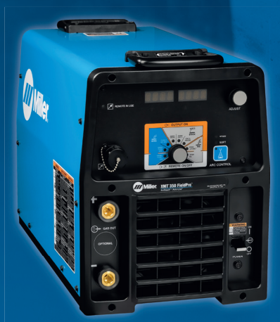
XMT 350 FieldPro™