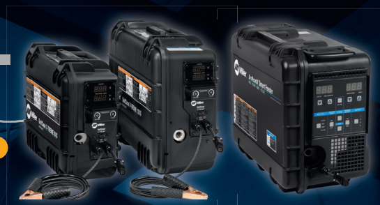
ArcReach® SuitCase® 8 ArcReach® SuitCase® 12